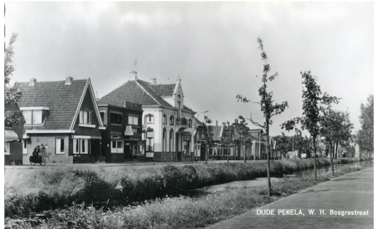
W.H.Bosgrastraat nabij Nieuwe Pekela

Langs het Diep vestigden zich steeds meer reders, kapiteins en matrozen. De scheepvaart bracht welvaart en zorgde voor verdere groei van de nederzetting. Deze periode is nog altijd herkenbaar in het landschap en de bebouwing. Diverse panden en structuren langs het Diep verwijzen naar de bloeitijd van de scheepvaart en handel in de 18e en 19e eeuw.