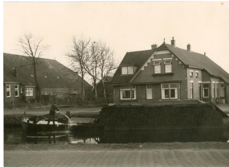
Een schip met turf in het Pekelderdiep