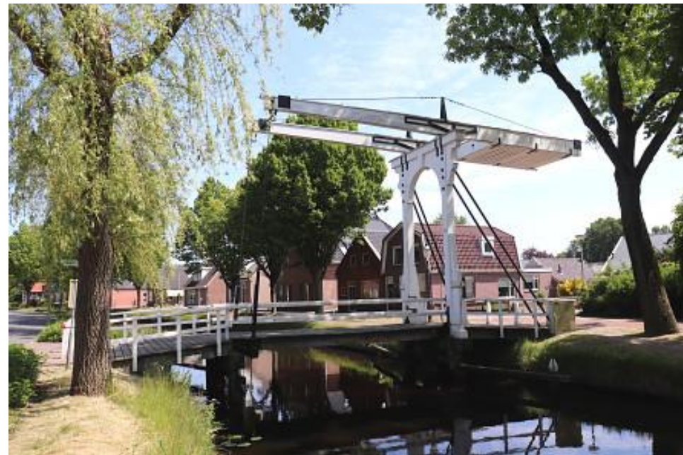
Houten klapbrug bij de Haanswijk